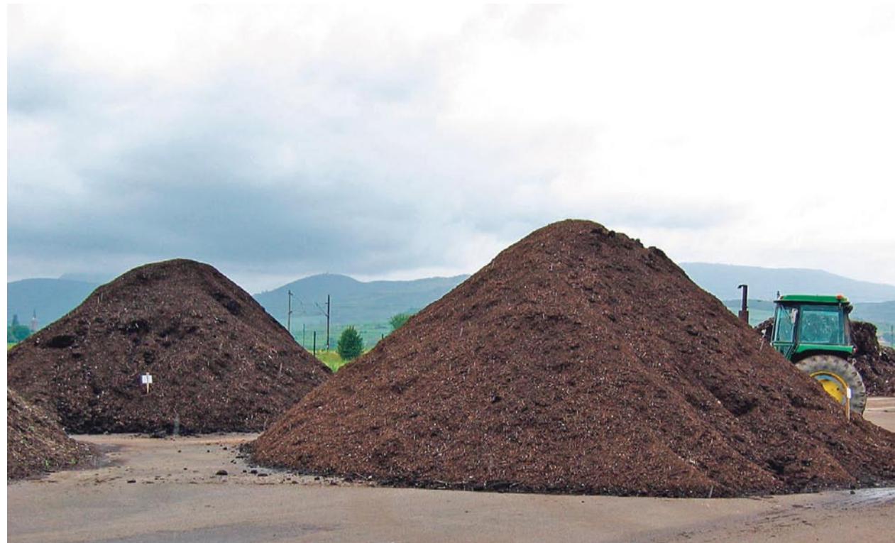
Qu'il soit sous statut «déchets» ou «produit», la traçabilité du compost doit être assurée à toutes les étapes de sa fabrication, de la boue d'origine jusqu'au compost final.

Le compost de boues bénéficie d'une meilleure acceptabilité que les boues brutes. Déshydraté et presque sans odeur, il rappelle le terreau utilisé dans nos jardins et présente les avantages cumulés d'un amendement et d'un en-